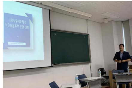
〈남춘호 연구원 발표〉