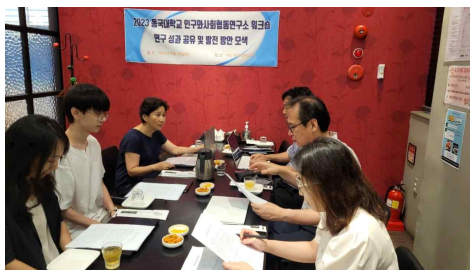
〈CCRPS 2023 워크숍 전체 회의 모습〉

지난 8월 24~26일, 2023 CCRPS 워크숍을 진행하였다. 이번 워크숍에서 지역사회통합돌봄 연구팀과 장애(인)연구팀 성과와 진행상황을 파악하고, 향후 연구 방향성 모색을 논의하는 자리를 가졌다. 또한 이번 워크숍을 통해 학술적 방향과 국제 연구 네트워크 확대 등도 다양하게 논의하였다.