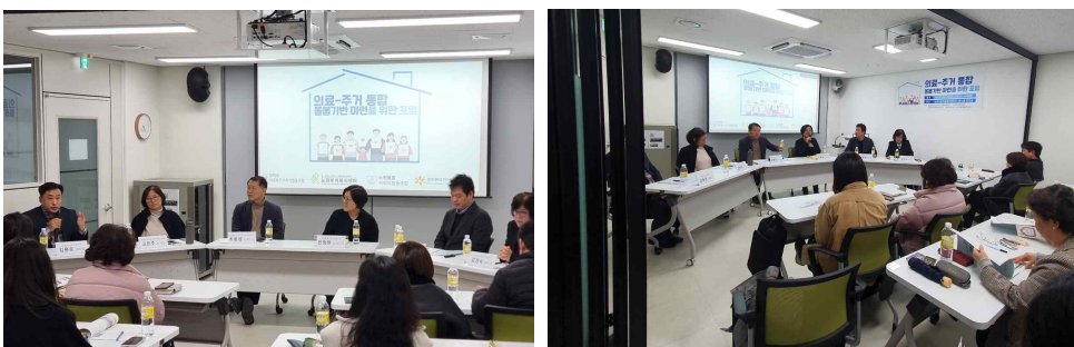
<연구성과 공유회 발표>