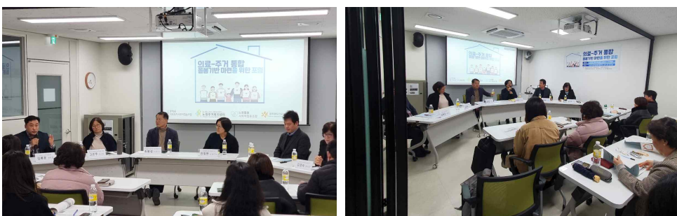
<연구성과 공유회 발표>