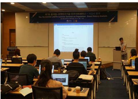
인구서머세미나 제1차 워크숍(08.03)