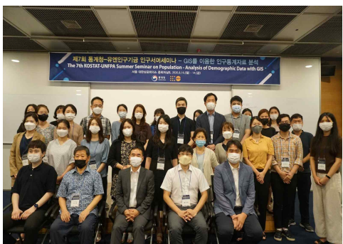
인구서머세미나 제2차 워크숍(08.10)