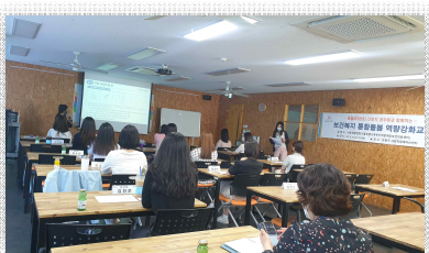
▲ 은평구 연구결과 보고회 전경

지난 6월, 우리 연구소는 그간 연구하던 성동구와 은평구의 통합돌봄 네트워크 분석과 전략 수립을 마무리하고 전략 보고서를 발간하고 이를 해당 구청에 전달하였다. 이 연구는 현장경험을 바탕으로 한 지역사회 통합돌봄에 대한 총체적인 현황을 다층적이고, 맥락적으로 분석함으로써, 지역사회기반의 노인통합돌봄 지원체계 모델구축의 기초자료로 활용가능하다. 이를 통해 해당 구의 통합돌봄 네트워크가 강화될 것으로 기대하고 있다. 특히 은평구에서는 연구결과 강연 요청이 있어 담당공무원들을 대상으로 연구결과 보고회를 진행하였고, 현장 돌봄종사자들을 대상으로 2단계 조사에 관한 요청에 따라, 이에 관한 협의를 진행할 예정이다.