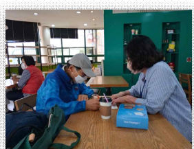
▲ 복지관 설문조사 과정

지난 9월, 2022년 서울지역 지역사회통합돌봄 대상자 욕구조사 최종보고회를 진행하였다. 해당 욕구조사는 서울시 4개구(성동, 은평, 마포, 송파) 소재 복지관을 이용하는 고령자 및 종사자를 대상으로 지역사회 돌봄서비스 인식을 확인하고자 실시하였다. 총 응답자는 고령자 1765명, 종사자 261명이 참여하였다. 특히 코로나로 인해 복지관 접근이 쉽지 않아 조사에 많은 어려움이 발생했지만, 적극적인 대처하여 원만하게 진행하였다. 현장조사는 리서치코리아를 통해서 진행하였고, 최종보고 회의에서는 최종 보고서 작성에 추가될 사항을 논의하였다. 향후 최종보고서에서는 코딩북 및 데이터화 작업 및 인구사회학적 특성 구분을 추가적으로 보완할 예정이다. 이와 함께 부산 4개 구(부산진구, 북구, 영도구, 해운대구)의 복지관 종사자의 조사 결과 보고서 및 저서 발간을 위한 작업을 진행 중이다.