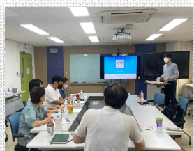
▲ 최종보고회 전경