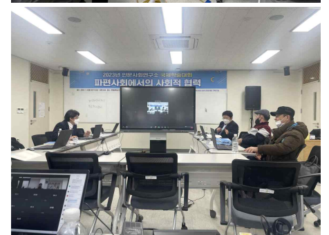
〈국제학술대회 현장 사진〉